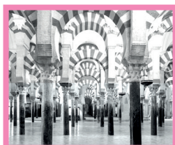
(ب) مسجد جامع قرطبه