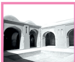
(پ) مسجد فهرج